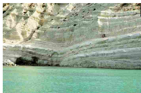
Scala dei Turchi - Realmonte