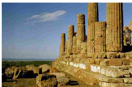
Valle dei Templi e area Archeologica - Agrigento