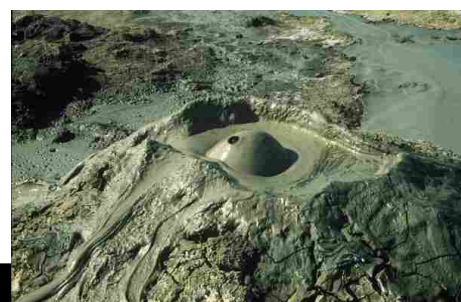
Riserva Naturale delle Macalube – Aragona