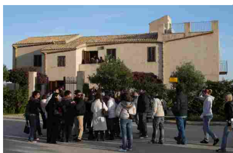
Museo e Casa Natale Luigi Pirandello - Agrigento