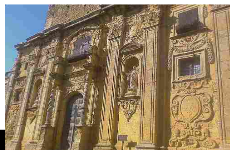
Città del Barocco – Naro